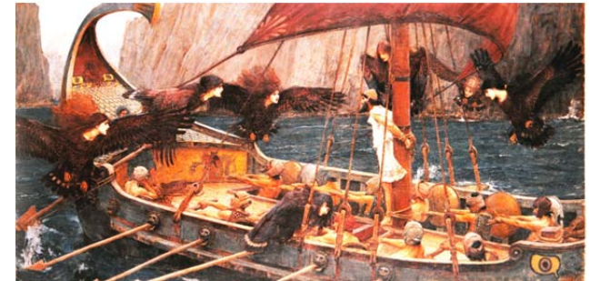
Ulises y las Sirenas, W. Waterhouse (1849-1917)